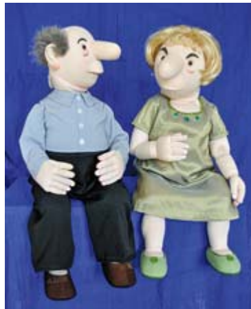
Neuproduktion: «Die Ente bleibt draussen!», ein Lorient-Abendprogramm mit allerlei Figurenarten.

Im Familienprogramm kommt zu Beginn «Dr Dominik Dachs», die