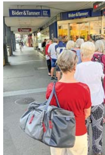
Letztes Jahr bildeten sich eine lange Warteschlange zum Vorverkauf Saisonbeginn bei Bider und Tanner.

Das detaillierte Saisonprogramm ist ab sofort unter www.baslermarionettentheater.ch abrufbar. Der Vorverkauf für alle Vorstellungen beginnt am Samstag, 14. September 2024 um 9 Uhr. ■